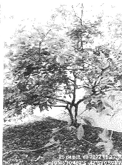
Figura 2 – Goiabeira próxima ao muro.

Diante do exposto, recomendamos o DEFERIMENTO do pedido de supressão dos espécimes considerando incompatibilidade dos mesmos com o equipamento público.