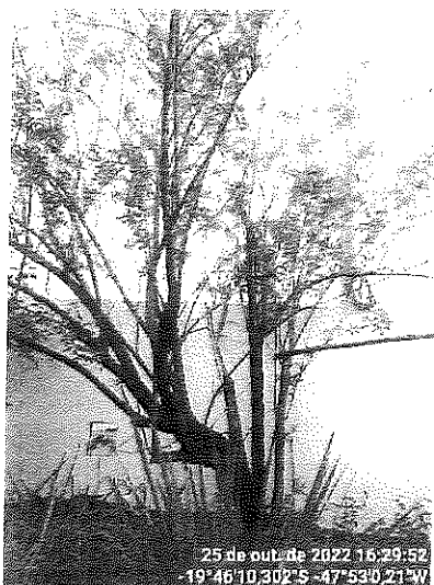
Figura 1 – Espécime não identificado próximo ao poço artesiano.

A goiabeira está alocada próximo ao muro da instituição e levemente inclinada na direção oposta com o sistema radicular projetado em direção a ele e, portanto, à medida que crescer vai comprometer-lo. Quanto ao espécime não identificado, encontra-se próximo ao poço artesiano, gerando incompatibilidade com o equipamento, em especial pelo crescimento do sistema radicular, além disso, seu crescimento vai afetar eventuais manutenções.